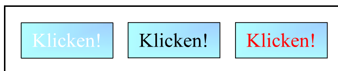
Abb. 3: Animation einer Schaltfläche

Animierte Schaltflächen hast du sicherlich schon einmal gesehen: sie werden „lebendig“, wenn der Mauszeiger in ihre Nähe kommt. In Abb. 3 ist eine mögliche Animation zu sehen. Sobald der Mauszeiger auf die Schaltfläche gelangt, wechselt die Schrift ihre Farbe von weiß nach schwarz. Sie wird wieder weiß, sobald der Mauszeiger die Schaltfläche verlässt. Beim Anklicken erhält die Schrift eine rote Farbe.